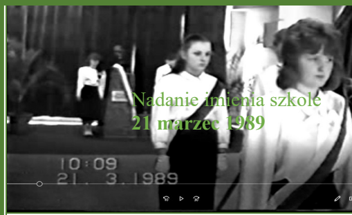
Nadanie imienia szkole 21 marzec 1989