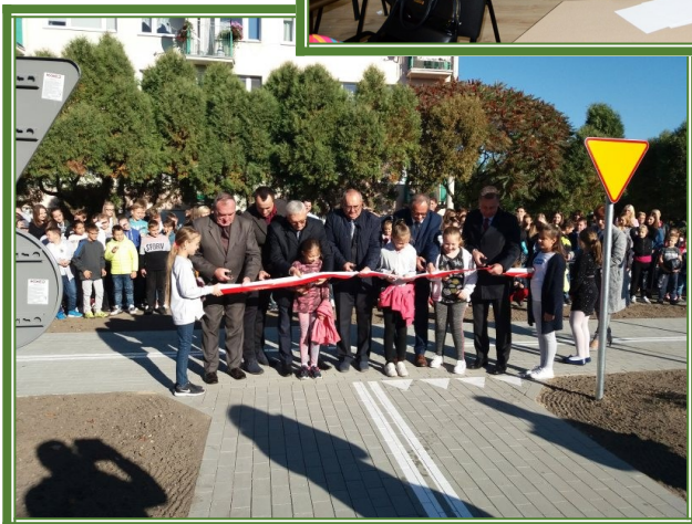
Uroczyste otwarcie Miasteczka Ruchu Drogowego 2018