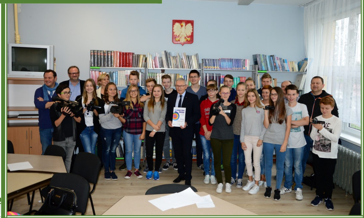
Nakręcona Gmina - warsztaty filmowe i telewizyjne 2016