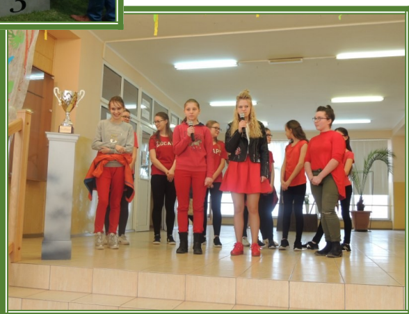
Obchody Dnia Patrona 2018