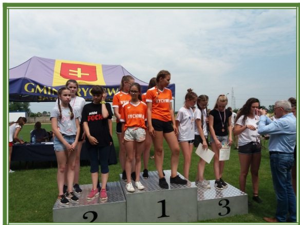
Letnia Gminna Spartakiada Sportowa z okazji Dnia Dziecka 2018