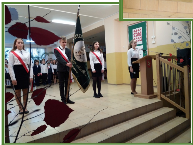
Uroczysty apel z okazji 100 rocznicy Odzyskania Niepodległości 2018