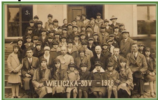
Wycieczka do Wieliczki maj 1928